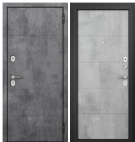
ППП Чёрный муар E-194 Бетон тёмный / E-194 Бетон серый