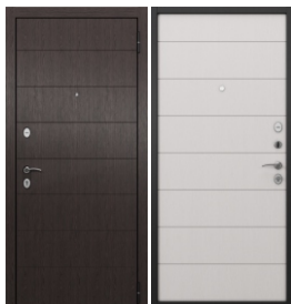
ППП Чёрный муар E-135 Венге / E-135 Белый ларче