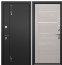
ППП Чёрный муар RL-11 чёрный муар/142 Бьянко ларче, Lacobel White