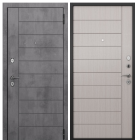
ППП Чёрный муар E-136 Бетон тёмный / E-136 Бьянко ларче