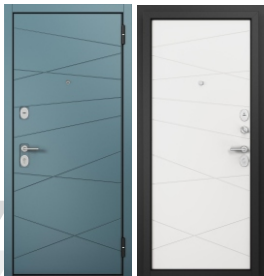
ППП Чёрный муар E-130 Верде / E-130 Белый софт