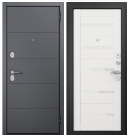
ППП Чёрный муар E-194 Оскуро / 142 Ларче белый, Lacobel White