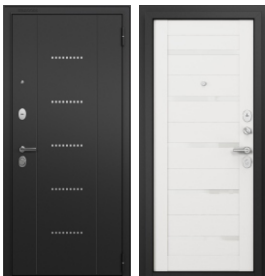
ППП Чёрный муар RL-12 Чёрный муар/142 Белый ларче, Lacobel White