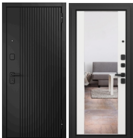
ППП Чёрный муар / Чёрная фурнитура. E-161 Чёрный матовый / E-164 Белый софт