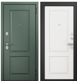
ППП Чёрный муар ED-1 Авокадо / ED-1 Белый софт